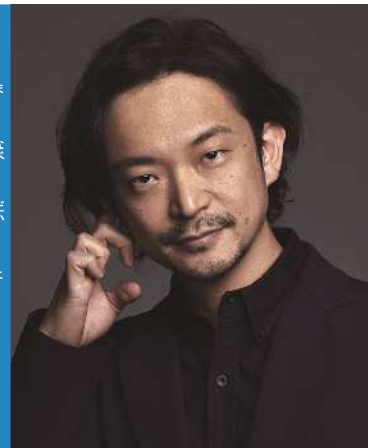
まなべ だいた 真鍋大度氏

アーティスト、プログラマ、コンポーザ。2006年Rhizomatiks設立。2022年Studio Daito Manabe設立。身近な現象や素材を異なる目線で捉え直し、組み合わせることで作品を制作。高解像度、高臨場感といったリッチな表現を目指すのではなく、注意深く観察することにより発見できる現象、身体、プログラミング、コンピュータそのものが持つ本質的な面白さや、人間と機械、アナログとデジタル、リアルとバーチャルの関係性、境界線に着目し、様々な領域で活動している。坂本龍一、Bjork、OK Go、Nosaj Thing、Squarepusher、アンドレア・パッティストーニ、野村萬斎、Perfume、サカナクションを始めとした様々なアーティストからイギリス、マンチェスターにある天体物理学の国立研究所ジョドレルバンク天文物理学センターやCERN（欧州原子核研究機構）との共同作品制作など幅広いフィールドでコラボレーションを行っている。